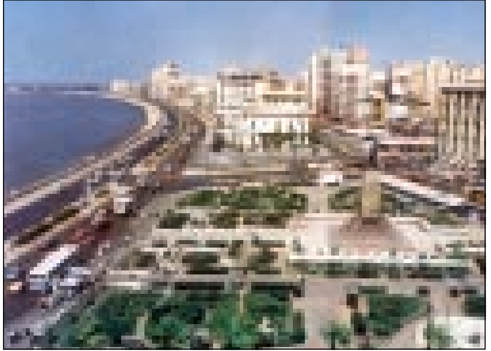
الاسكندرية عروس البحر المتوسط