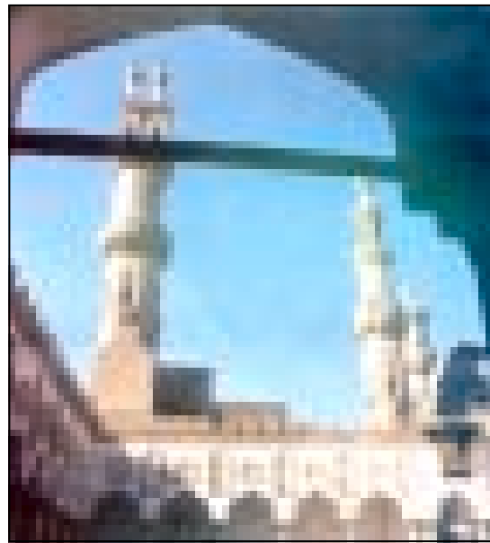
الأزهر الشريف .. منارة للعلم والاسلام

● أما في مصر الجديدة فهناك حديقة ملاهي سندباد وتفتح نوادي