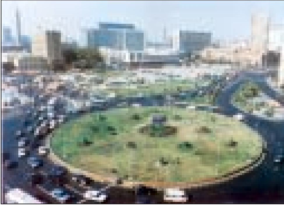
المعمار القديم والحديث في قلب القاهرة