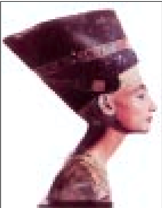
نثرتي .. جميلة الجميلات

● وفي الصيف يصبح شارع جامعة الدول العربية اسما على مسمي فهو المكان المفضل للسياح العرب فهو شارع لا ينام ففي النهار هناك المتاجر التي تصطف على جانبيه وتعرض أحدث الموضات وفي الليل يكثر السهر في الحديقة التي تحولت الى مقهى كبير يصطف فيه الباعة الذين يعرضون أكالات ومشروبات شعبية ويؤجرون دراجات والعباب الاطفال.. بل وصل الأمر الى وجود الخيل والجمال ولكن من يرغب في ركوب الخيل بطريقة جادة يذهب الى منطقة الاهرامات وابي الهول وينطلق في هضبة الهرم ويستطيع المرور على قرية كرادسة أشهر سوق للملابس التقليدية والسجاد والمفارش الصوفية.