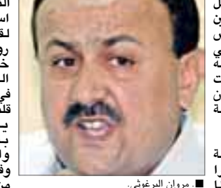
■ مروان البرغوثي.

المحكمة على اقوال البرغوثي هذه بقولها تعتقد ان ما قاله روبينشتاين ليس جيدا . هذا يمس في الاجراءات القانونية. يذكر ان روبينشتاين كان قد ارسل رسالة الى رئيس الحكومة الإسرائيلي ارنيل شارون في اعقاب التقارير حول مطالبه الفلسطينيين بإطلاق سراح البرغوثي في إطار خارطة الطريق . وقد قال روبينشتاين عن البرغوثي انه مهندس إرهاب من الدرجة الاولى واضشاف ان إطلاق سراحه ليس واردا .