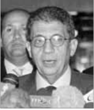
■ عمرو موسى.

واكد الشفيع مجددا تمسك الحكومة والمؤتمر الوطني وكافة الشعب السوداني بعملية السلام ومسار التفاوض في إطار الایجاد الحالي شريطة ان يحقق التفاوض السلام العادل والشامل والمستدام وقال ان الطرح الذي تقدم به الوسطاء لا يحل او يعني اي من هذه الشروط . وقال ان المجلس القيايدي للحزب اكد في اجتماعه امس كذلك على ضرورة ان يعمل الوسطاء على تحقيق السلام في السودان على تقديم طرح يساعد على الوصول الى السلام الذي ينظره كل ابناء السودان وان لا يكون الوسطاء اداة لوضع العراقيل امام مسيرة السلام .