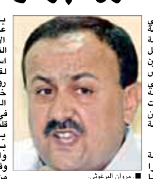
■ مروان البرغوثي.

المحكمة على اقوال البرغوثي هذه بقولها تعتقد ان ما قاله روبينشتاين ليس جيدا . هذا يمس في الاجراءات القانونية. يذكر ان روبينشتاين كان قد ارسل رسالة الى رئيس الحكومة الإسرائيلي ارنيل شارون في اعقاب التقارير حول مطالبه الفلسطينيين بإطلاق سراح البرغوثي في إطار خارطة الطريق . وقد قال روبينشتاين عن البرغوثي انه مهندس إرهاب من الدرجة الاولى واضشاف ان إطلاق سراحه ليس واردا .