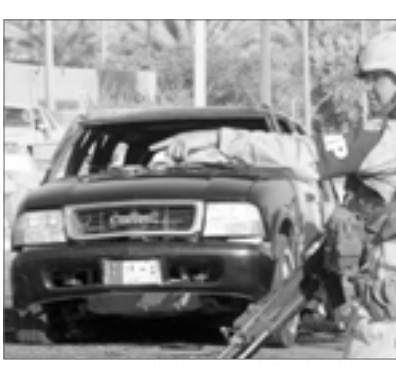
■ جندي امريكي يقف امام سيارة دبلوماسية تعرضت لانفجار وسط بغداد.