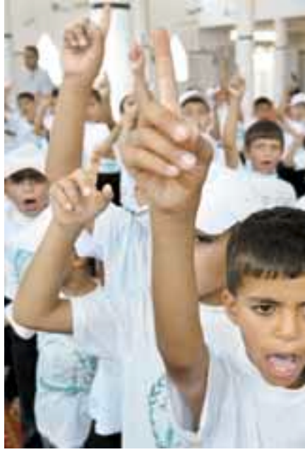
أطفال فلسطينيون يرددون أناشيد دينية في مخيم صيفي في غزة.

وحملت الحركة في بيان لها أمس الحكومة الإسرائيلية مسؤولية التعدي على المقدسات والسماح للمطرئين اليهود بانتهاك حرمة المسجد الأقصى