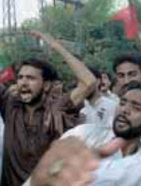
مظاهرات احتجاج في لاهور احتجاجاً على المجزرة التي حدثت في مسجد كويتا

وقد هاجم المعتدون حشود المصلين فيما كانوا يخرجون من مسجد بعد صلاة الجمعة في وسط كويتا .