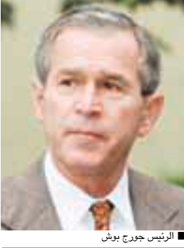
الرئيس جورج بوش

ويتوقع أن يتعرض بوش إلى انتقادات خلال جولته خاصة بالنظر إلى سياسات أمريكا نحو أفريقيا التي طابعها الفطرسية واللامبالاة ..